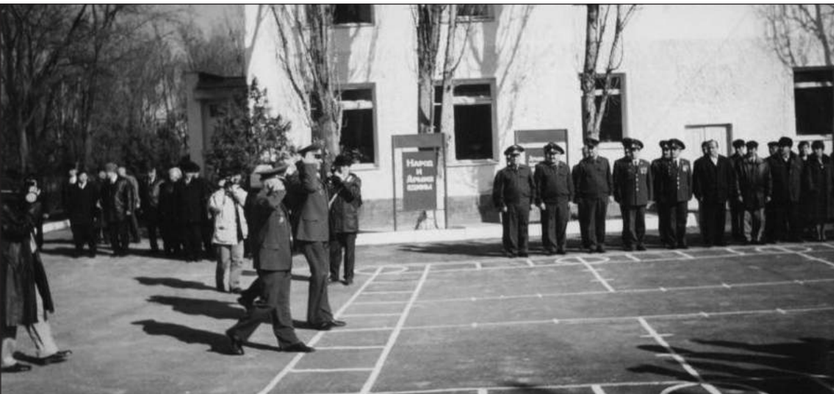
Они стояли у истоков формирования и укрепления трудовой и воинской дисциплины военного комиссариата