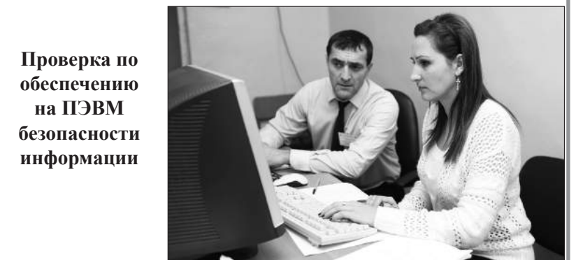
Проверка по обеспечению на ПЭВМ безопасности информации