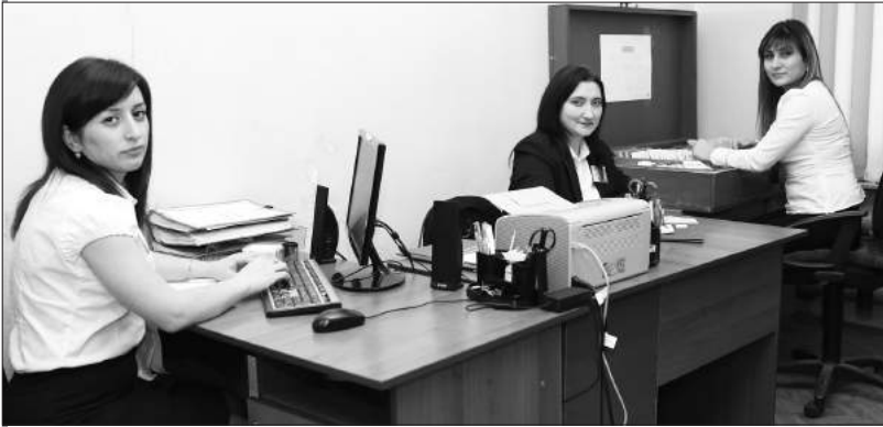
Уточнение и сверка документов по учету офицеров запаса