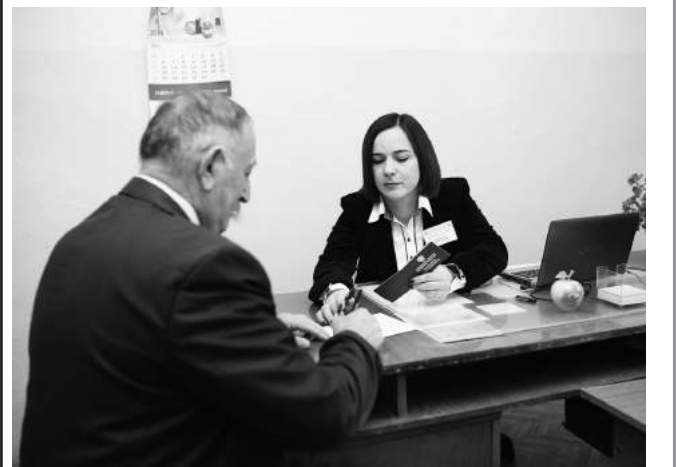
Работа с гражданами, имеющими право на льготы

Военный комиссариат в тесном взаимодействии с управлениями образования, Советами ветеранов войны и труда города и районов проводит профориентационную работу среди учащихся по улучшению военно-патриотического воспитания молодежи.