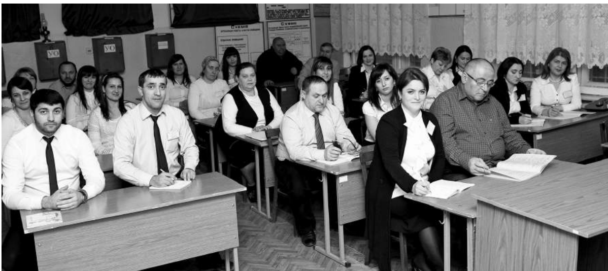
Заседание профсоюзной ячейки и информирование работников