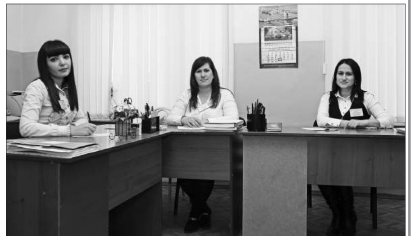
Уточнение и сверка документов по учету солдат, сержантов запаса