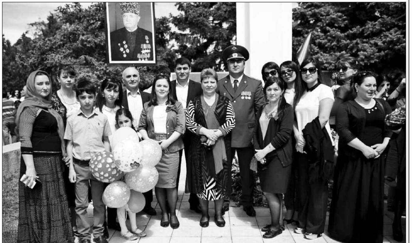
День Победы – возложение венков к обелиску Славы!

Граждане, призванные военным комиссариатом, принимали участие в ликвидации аварии на ЧАЭС. К сожалению, из 142 военнообязанных в живых осталось только 49 человек. Также активно военнослужащие участвовали в выполнении задач во время вооруженного конфликта в Чеченской Республике и на