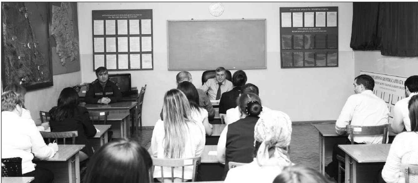
Специальная ПД подготовка с работниками военного комиссариата