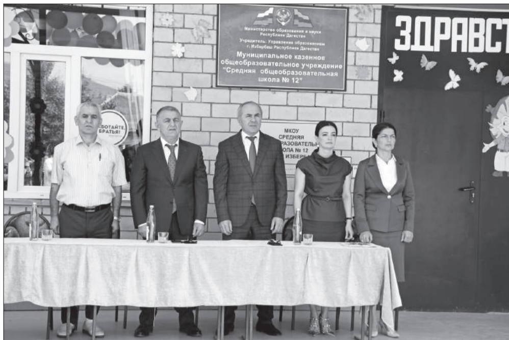
(Окончание. Начало на стр. 1).

За долгие годы своего существования этот замечательный школьный праздник не особо изменился: те же испуганно-счастливые мальчики и девочки в новой школьной форме, пока что ещё непотрепанные сумки и портфели, гульки украшенные классные комнаты и охапки разноцветных букетов на столе у учительницы.