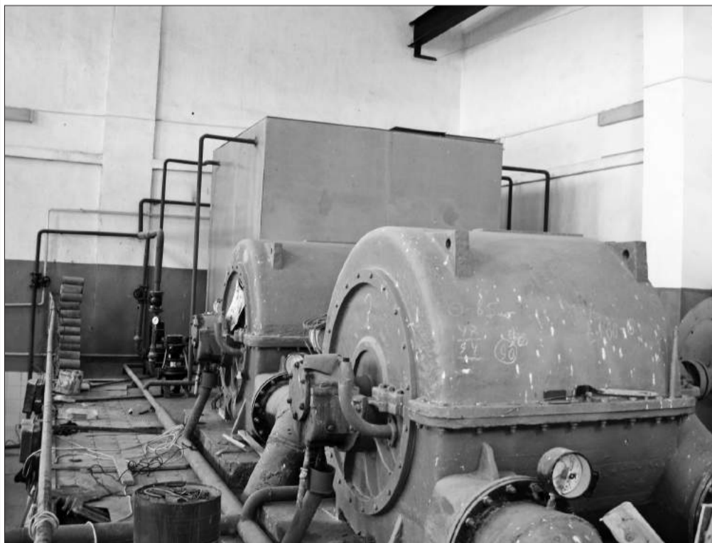
Новые двигатели ГОСК.

Дополнительную информацию о конкурсе можно получить по тел. 2-49-13.