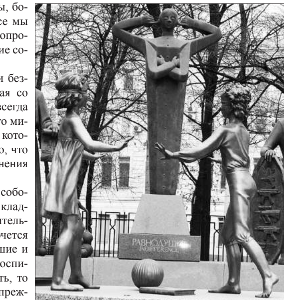
Единственный выход – не брать за основу пример этих людей, чтобы паралич души не стал всеобщим.

Переpravляться лучше группой, соблюдая дистанцию друг от друга 5-6 метров. Прочность льда проверяют пешней или толстой палкой, ударяя ею 2-3 раза в одно и то же место, как можно дальше впереди от себя.