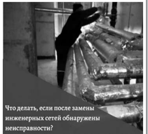
Что делать, если после замены инженерных сетей обнаружены неисправности?

Пресс-служба ООО «Газпром межрегионгаз Махачкала».